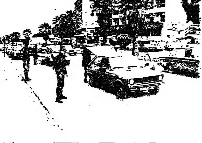
التفتيش عن السلاح

جاءت دوريات للجيش وقوى الأمن الداخلي، شوارع المنطقة الغربية للعاصة، أمس، وأقامت حواراً تفتيشياً، أحدها في منطقة الروشة، حيث لوقفت لحد المواطنين لجديته سلاحاً.